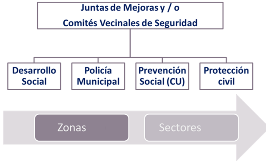
Ilustración 1. Actores relevantes de la comunidad